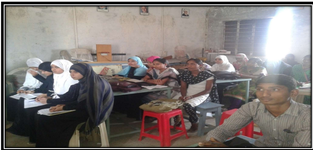
Above Psychology student's attend Psychology Seminar in Psychology Department