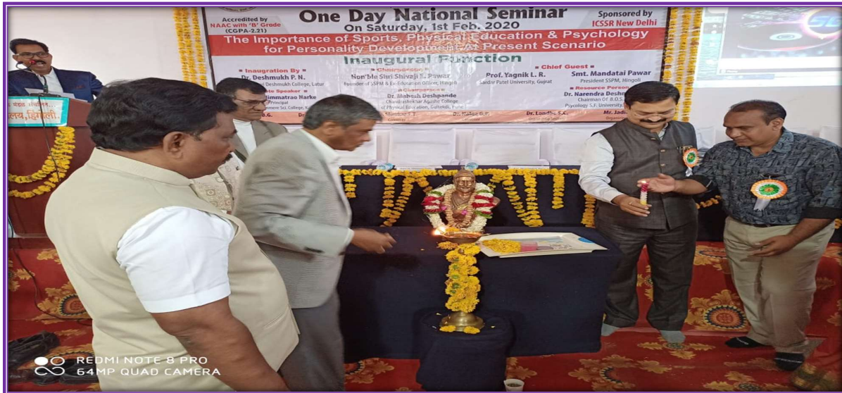
Inauguration function of this National Level Conference at Shivaji College Hingoli