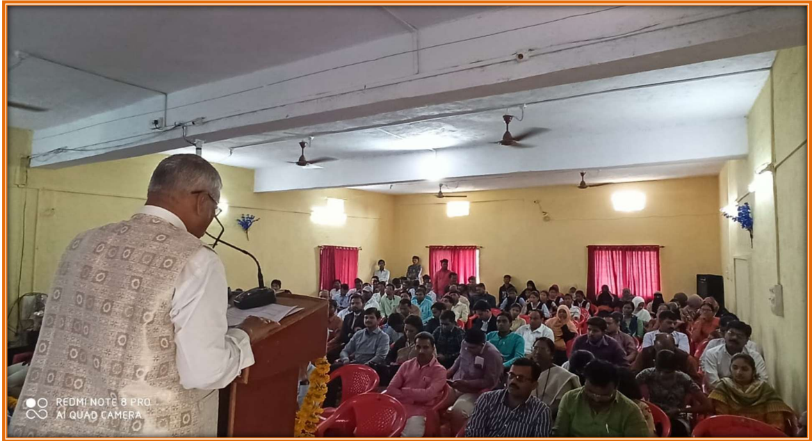
Keynote Speaker Respected Dr.H.J.Narke delivered his Speech during the National Conference