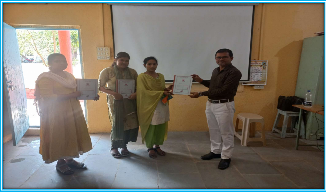
Group Photo of Topper students in the BASY Class. Academic Year 2022-2023