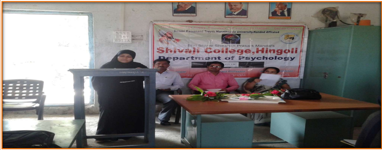
Above Psychology students Presenting Seminar in Psychology Department.