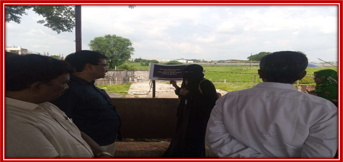
Psychology student showing the poster to the guest